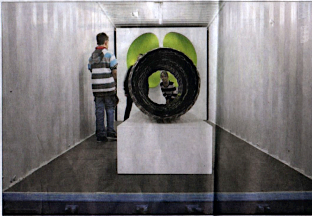
Vivant en symbiose avec le Comptoir, la biennale visarte.jura a ouvert les portes de ses quinze containers à un vaste public curieux de découvertes et de surprises.